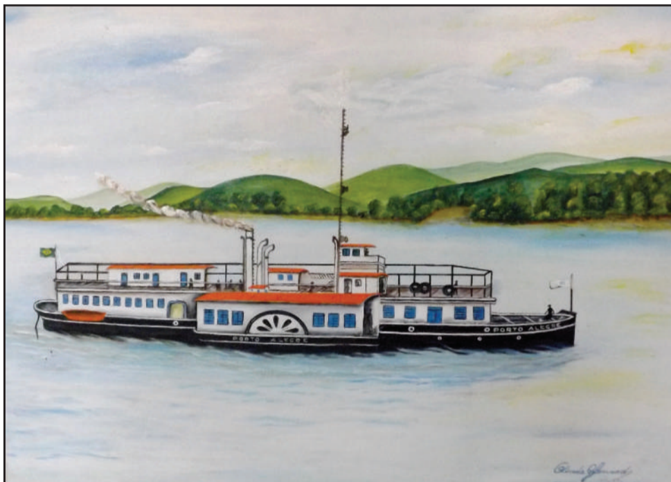
Vapor Porto Alegre – funcionou de 1883 até 1961, transportava as pessoas de Porto Alegre a Santo Amaro e vice-versa, partindo de Santo Amaro os passageiros no trem para as cidades fronteiriças.