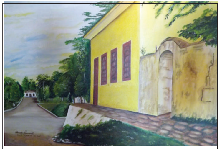
Prédio também tombado pelo IPHAN.

Primitivo Solar do cara de sola – era o apelido de um poderoso charqueador de Santo Amaro e nesta casa também foi instalado o quartel general de Chico Pedro que chefiou o exército Imperial que lutou contra os farroupilhas no alto da praça, neste episódio os farroupilhas foram derrotados.