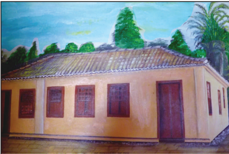
Prédio tombado e restaurado pelo IPHAN pertencente a família Atkinson.