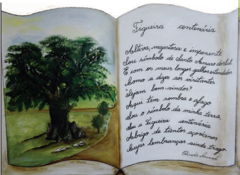
Figueira Centenária - com poema da professora Olinda.