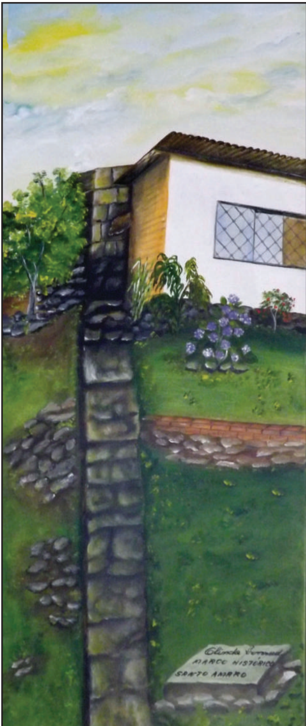
Marco Histórico da povoação de Santo Amaro – início da povoação em 1º de maio de 1752, pelo General Gomes Freire de Andrade.

Estação Férrea de Amarópolis – fundada em 1883 e funcionou até 1961, causou grande desenvolvimento para a população do município de Santo Amaro do Sul.