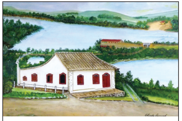
Prédio tombado em 178/2 - pertencente a família.