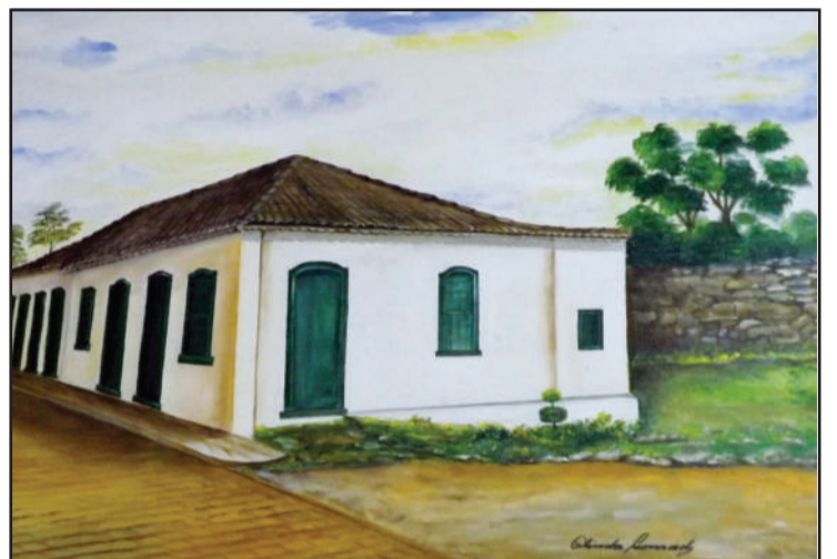
Conjunto de prédios tombados - restaurados pelo IPHAN