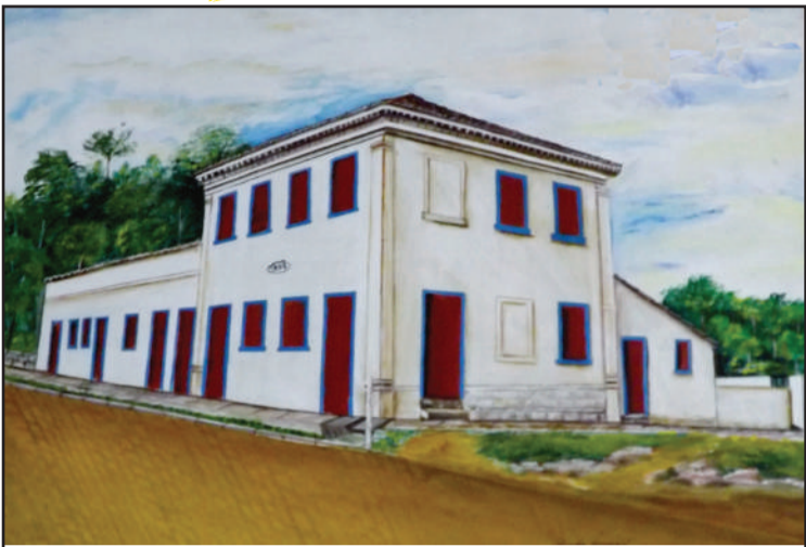
Hotel de Santo Amaro – fundado 1882 que servia para acomodar os viajantes do interior com destino a Porto Alegre.