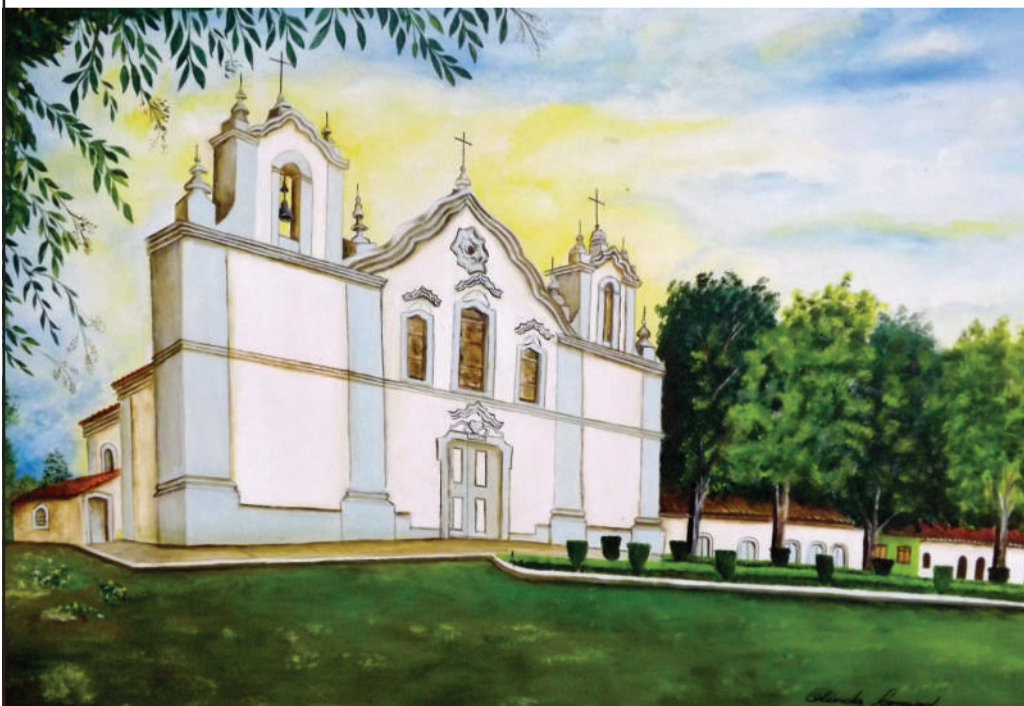
Igreja Matriz de Santo Amaro - fundada em 1787.